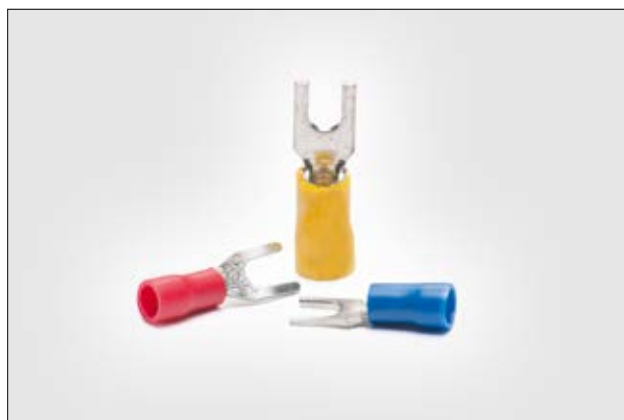
Terminal forquilha isolado.