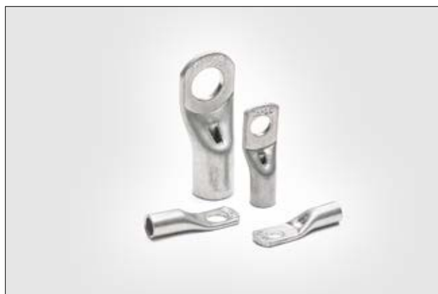
Terminal à compressão com um furo.