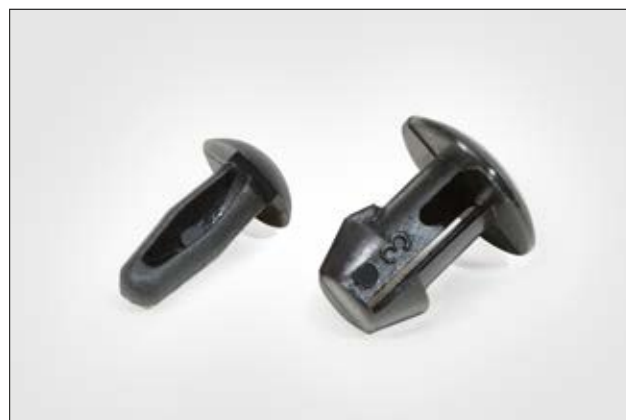
Pino de fixação PF1 e PF2.