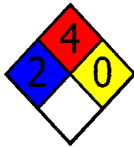
Diagrama de Hommel

SISTEMA DE CLASSIFICAÇÃO UTILIZADO: NATIONAL FIRE PROTECTION ASSOCIATION: NFPA 704.